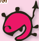
โรคเบาหวาน